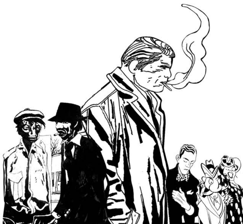
Alack Sinner y otros personajes de José Muñoz

Poster oficial del Festival de Angoulême 2008