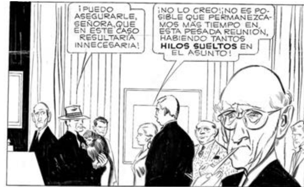
Alberto Breccia Las hojas de Kali Patoruzito N° 709 (1959)