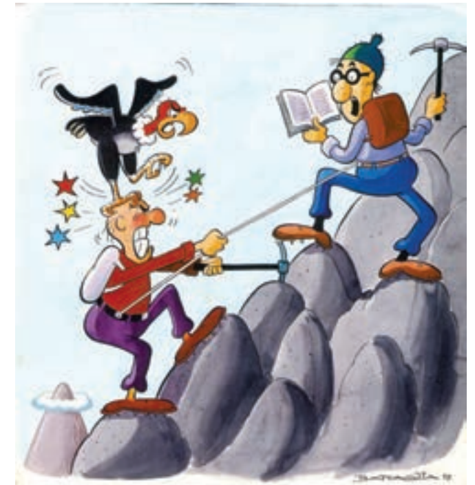
¿Cómo que te saque ese bicharraco de encima? Es un honor para vos que sea un pájaro de la especie "Picutus Alitus Garruas"