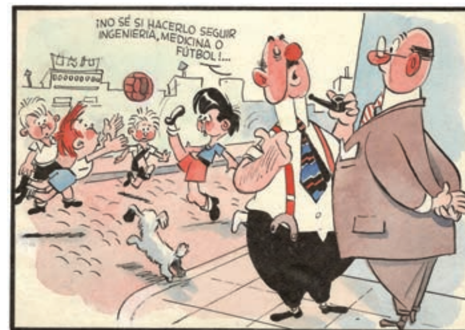
León Poch Libro de Oro de Patoruzú (1946)