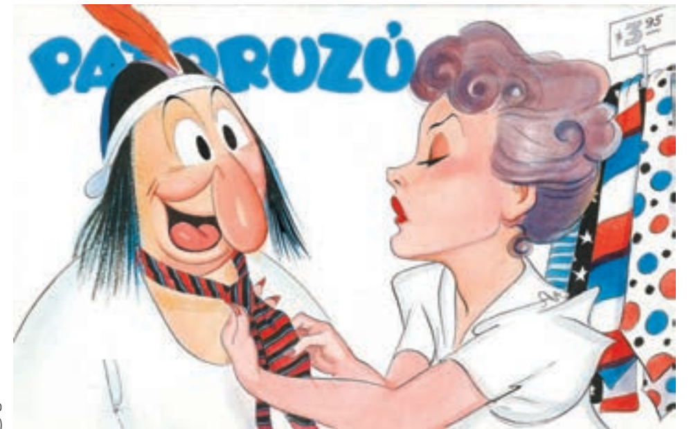
Dante Quintero Patoruzú N° 64 (1938)