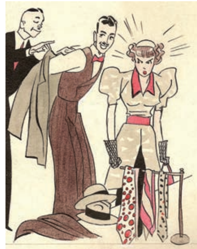
Rodolfo Claro Patoruzú N° 4 (1937)