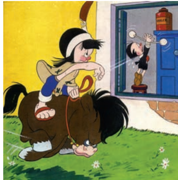
Tulio Lovato (lápiz) Jaime Romeu (tinta) Guillermo Roux (témpera) Revista Patoruzito N° 455 (c. 1953)

Horacio López para la Revista BePe N° 3 de 2007