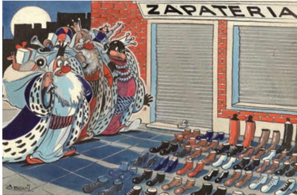
Pedro Seguí Libro de Oro de Patoruzú (1942)